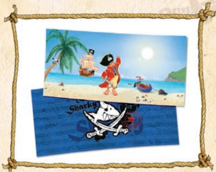
1. Poster an die Rückwand kleben