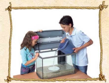
4. Wasser bis zur Hälfte einfüllen