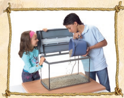
2. Kies waschen und im Aquarium verteilen