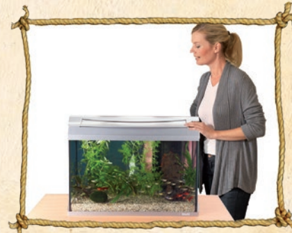
7. Filter und Heizer anschalten