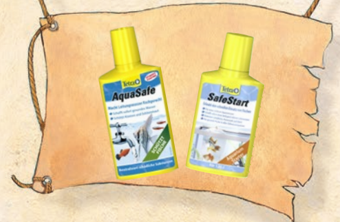
8. AquaSafe und SafeStart hinzufügen