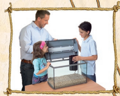
3. Filter und Heizer anbringen