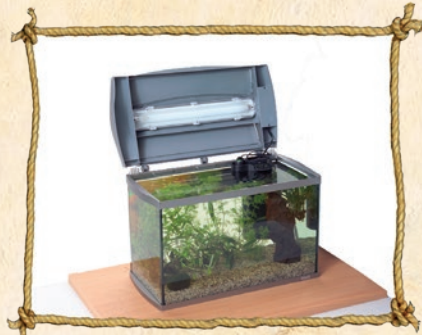
6. Wasser auffüllen