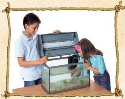
5. Pflanzen und Dekoration einsetzen